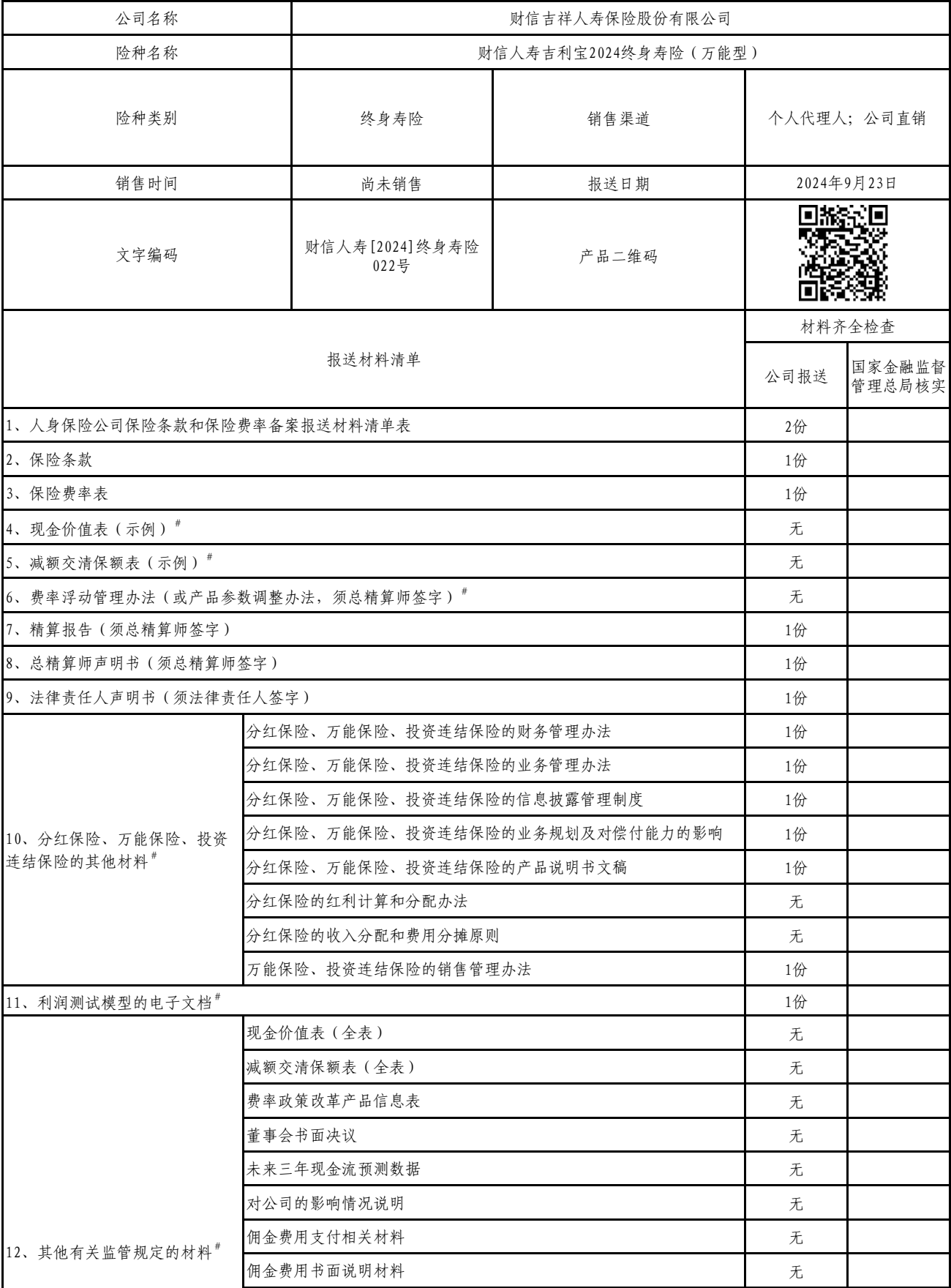
人身保险公司保险条款和保险费率备案报送材料清单表