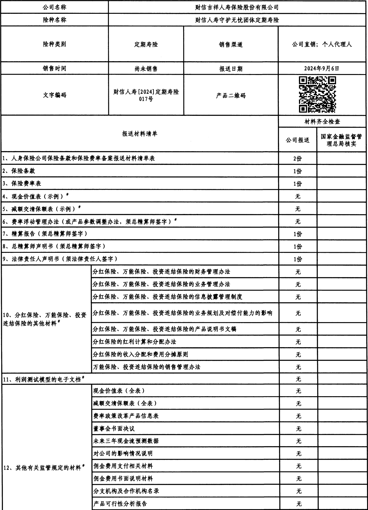
人身保险公司保险条款和保险费率备案报送材料清单表