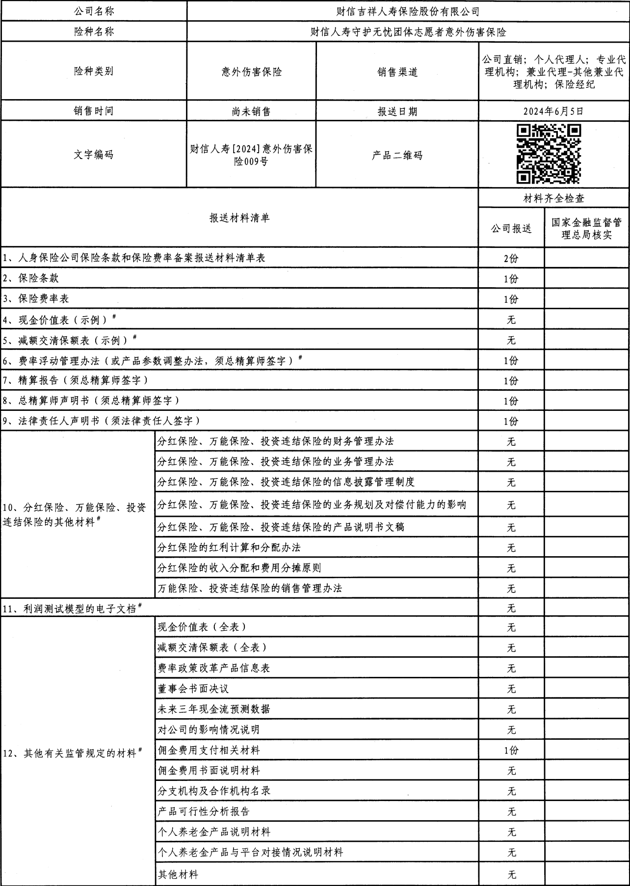
人身保险公司保险条款和保险费率备案报送材料清单表