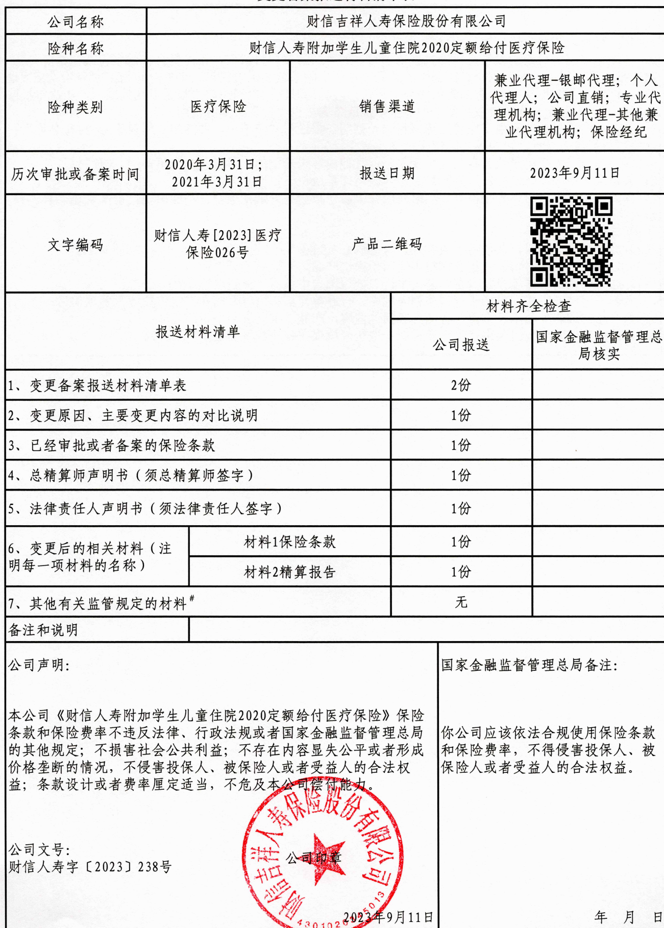
变更备案报送材料清单表